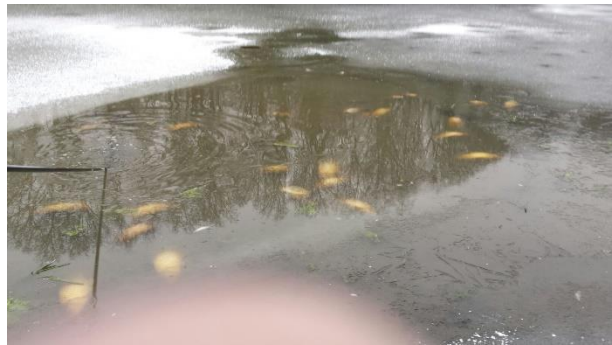
Dode vis in de Uikelaar. Vrijwel allemaal mooie en dikke schubkarpers.